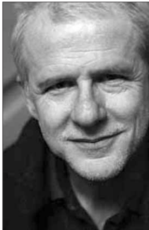
William Blank © DR