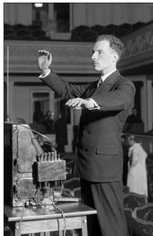
Léon Theremin